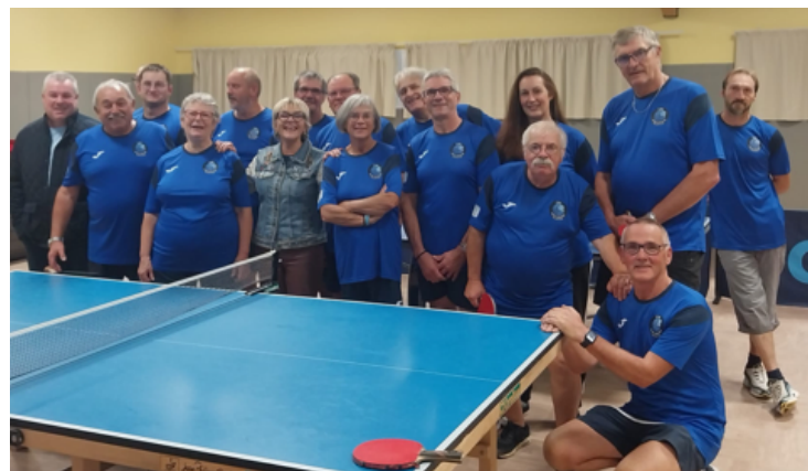
Section Tennis de Table – nouvelles tenues pour la saison 2025-2026

Un geste fort qui symbolise la solidarité locale et l'importance du lien entre les entreprises et le tissu associatif.