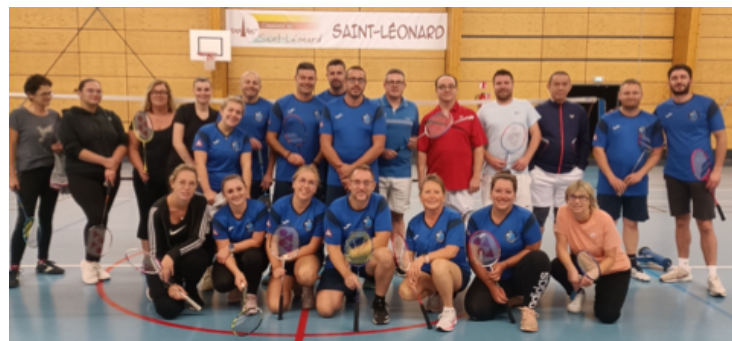
Section Badminton – effectif presque au complet pour la saison 2025-2026

Grâce à leur appui, les deux sections ont pu être équipées de tenues neuves et de qualité pour la saison à venir.