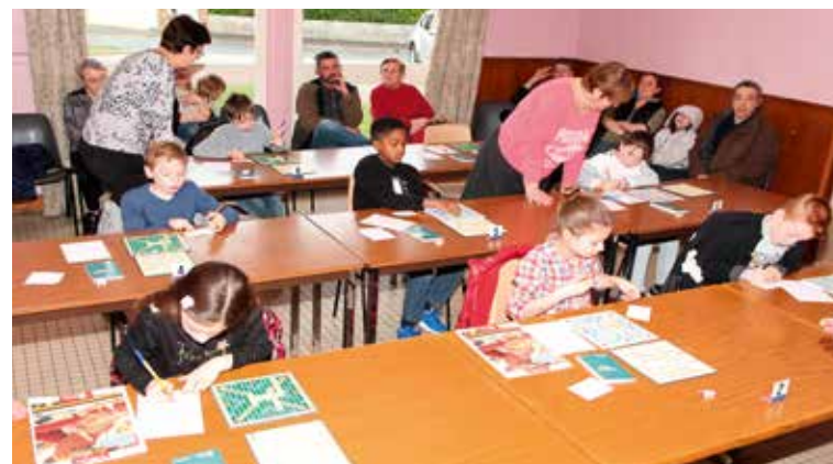
Finale locale 2017, 7 participants

Les compétitions de scrabble scolaire connaissent un succès grandissant : chaque année, de nouveaux élèves se lancent dans l'aventure, grâce à l'implication de leurs enseignants, parfois