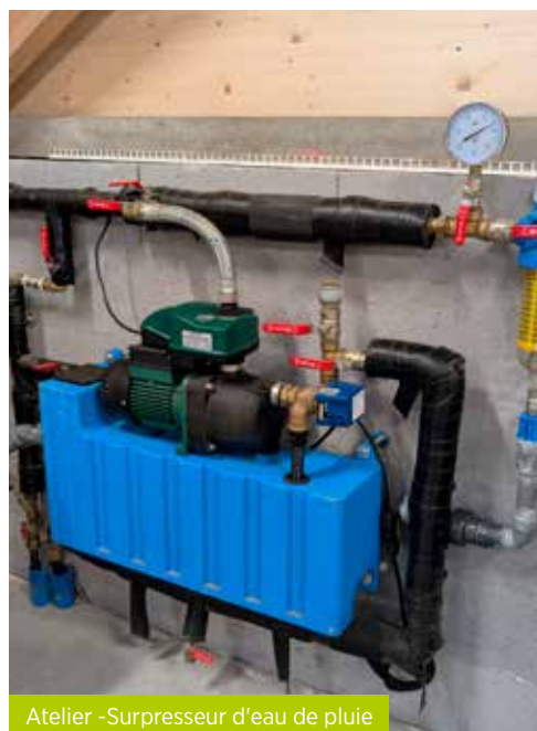
Atelier -Surpresseur d'eau de pluie