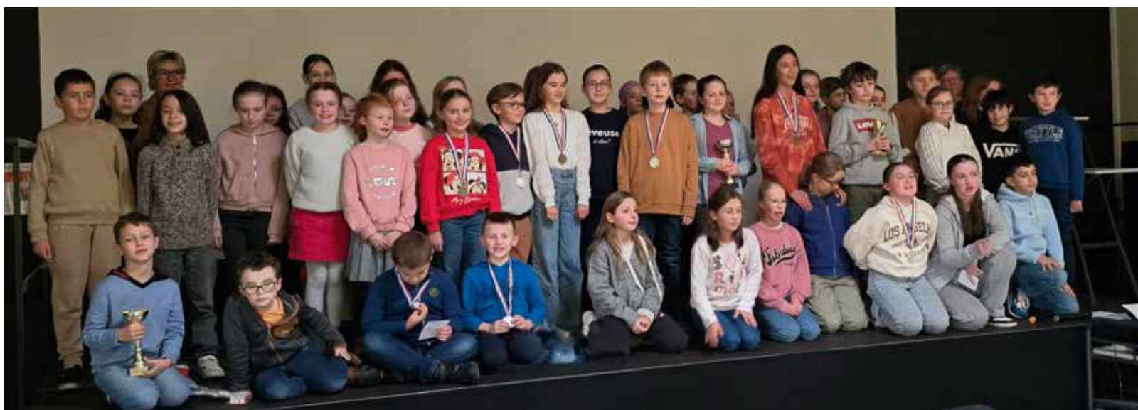
Finale locale 2024, 46 participants

Le mercredi et le vendredi, de 14h à 17h et le premier mardi du mois, à 19h, salle Henri Lambert.