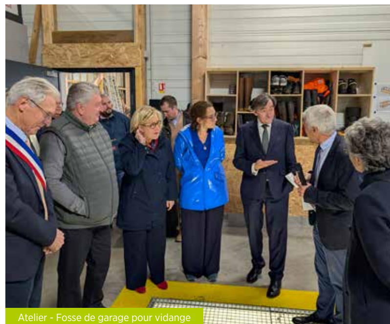
Atelier - Fosse de garage pour vidange