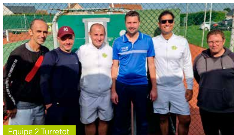
Equipe 2 Turretot