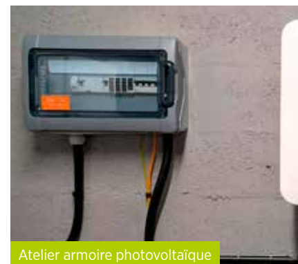
Atelier armoire photovoltaïque