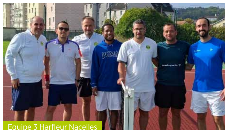
Equipe 3 Harfleur Nacelles